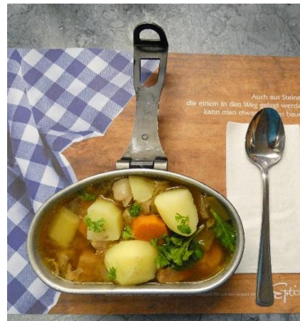
feine Suppe mit Spatz