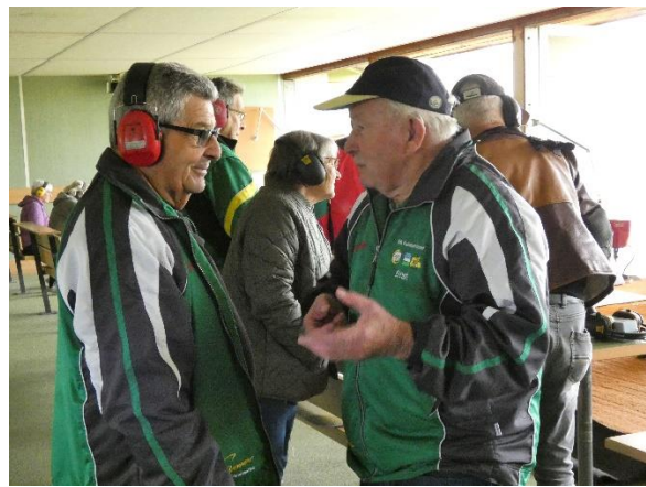
Gespräche unter Schützenkollegen